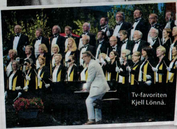
Tv-favoriten Kjell Lönnå.