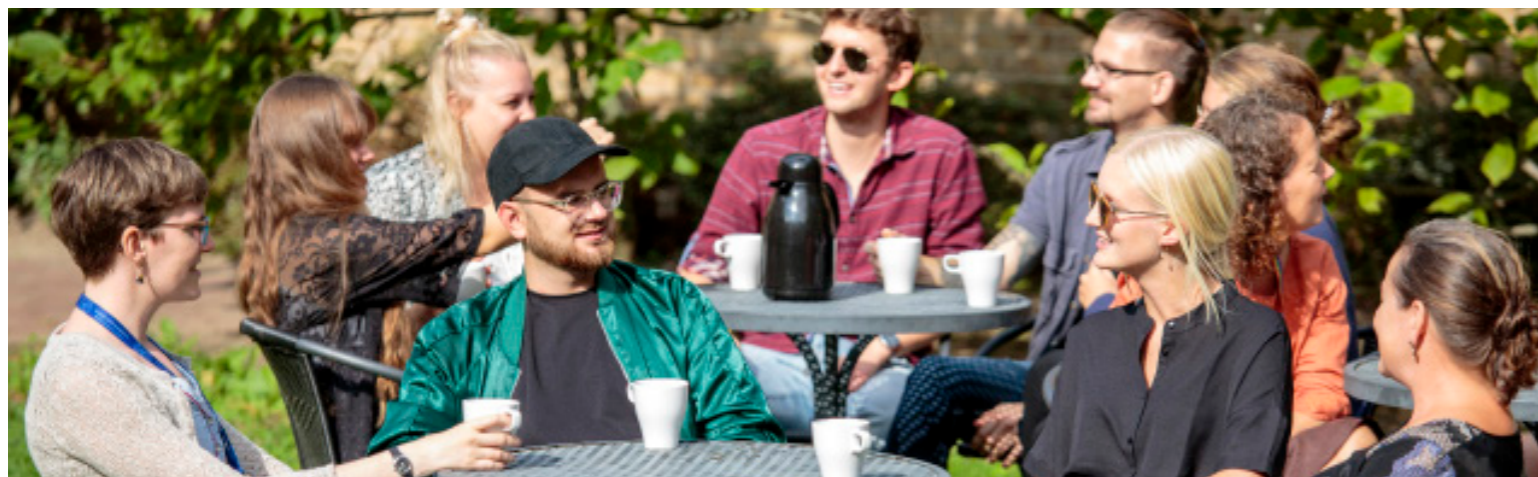
Musikhögskolans lummiga, gröna innergård är samlingsplats för kursdeltagarna under veckan.