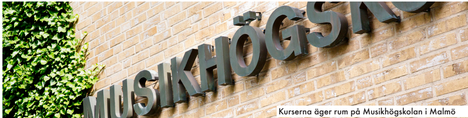
Kurserna äger rum på Musikhögskolan i Malmö

För elfte sommaren i rad ges kurser i kördirigering och körledning i Malmö, denna gång på Musikhögskolan i Malmö, Ystadvägen 25 . Kursveckan inleds måndag 6 augusti kl 13:30 och avslutas med konsert på Palladium kl. 15:00 lördag 11 augusti och efterföljande fest. Söndag 12 augusti är undervisningsfri och räknas som hemresedag.