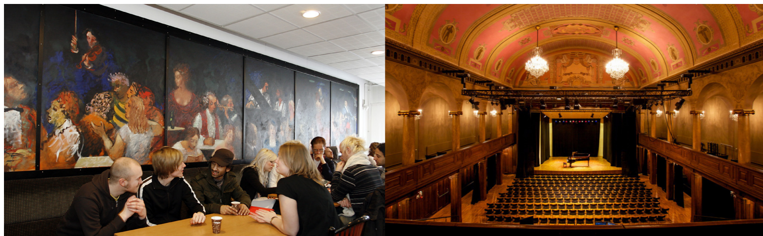
Cafeterian, där kursdeltagarna serveras mat under veckan (t.v.). Avslutningskonserten hålls på Palladium i centrala Malmö (t.h.)

Bekräftelse på antagning skickas med mail i början av maj. Brev med praktisk information och noter kommer att skickas i mitten av juni. Välkommen med din ansökan!